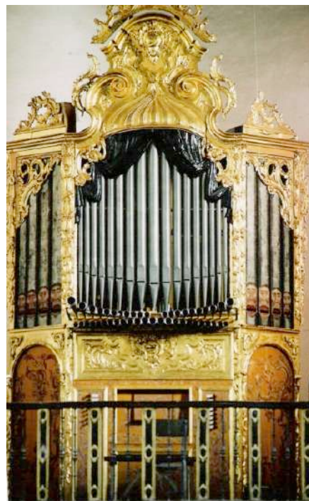
Órgano de San Pedro. Salvador Pabón, 1779.

Dos extraordinarios músicos, el contratenor Carlos Mena y la organista Mónica Melcova pondrán el broche de oro a la Academia Internacional de Órgano con un selecto concierto en la Iglesia de San Pedro y San Pablo, que alberga un órgano de 1779 obra de Salvador Pabón y Valdés, discreto en su tamaño pero de sonoridad exquisita e ideal para acompañar y servir de contrapunto a la voz del solista.