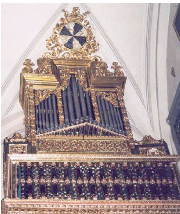
Órgano del Convento de Santa Catalina de Zafra (1730).

El órgano del Convento de Zafra, en la Carrera del Darro, es obra del fraile franciscano Francisco Alexo. Data de 1730 y se sitúa a la manera tradicional ibérica en un lateral de la nave junto al coro alto, con la peculiaridad propia de los órganos conventuales en los que el teclado se halla en la parte trasera del órgano para preservar la clausura del organista. Es un instrumento de excepcional belleza y posibilidades tímbricas, lo cual unido al recogimiento íntimo que se respira en la iglesia crea una atmósfera muy especial en los conciertos.