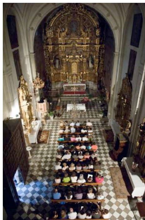
Concierto de órgano en el Convento de Zafra X Academia Internacional de Órgano (2011).