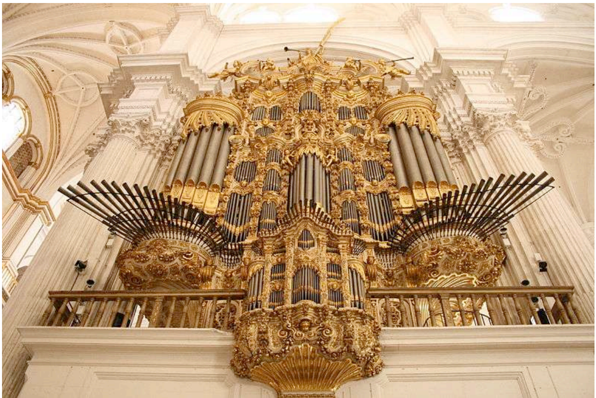
Catedral de Granada. Órgano de Leonardo Fernández Dávila, 1746.

Granada, del 9 al 13 de septiembre de 2014