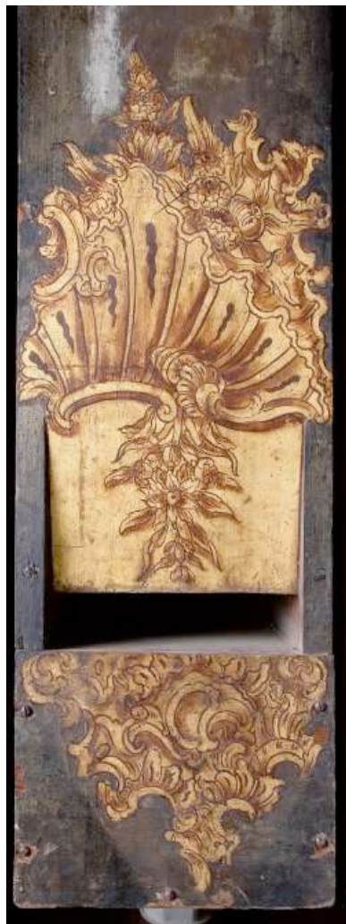
Detalle órgano Santos Justo y Pastor.

NOTA. El presupuesto estimado para los conciertos de la XIII Academia Internacional de Órgano es de 25.000 euros. Se está estudiando el costo de diversas actividades paralelas que irían incluidas en la programación de la citada Academia.