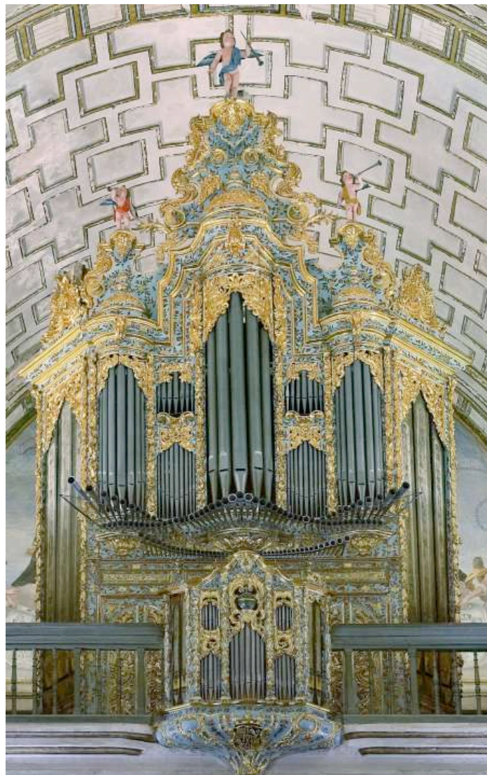
Órgano de la Iglesia de los Santos Justo y Pastor (1764)

La iglesia de los Santos Justo y Pastor (Plaza de la Universidad) posee el órgano que en origen fuera construido en 1764 para la Colegiata de El Salvador, y que fue trasladado en 1771 por el propio organero Salvador Pabón y Valdés. Su mueble es uno de los más bellos de la organería granadina. Fue restaurado en 2007 dentro del programa Andalucía Barroca junto con el monumental retablo móvil, cuya puesta en movimiento durante el concierto en la última edición constituyó un verdadero atractivo y primicia.