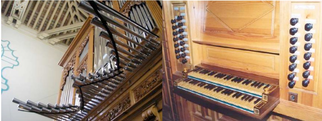
Perspectiva y teclados del órgano del Salvador.