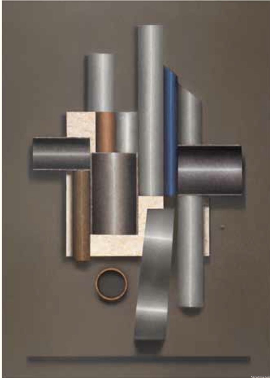
Antonio Cordero Ayala

Granada, del 8 al 13 de septiembre de 2015