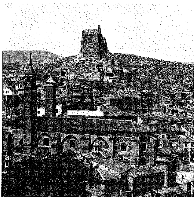
Borja. Vista parcial. Ex-Colegiata de Santa María y ruinas del histórico castillo